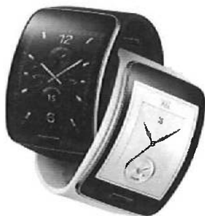
Samsung Gear S

功能：支援 3G 獨立通話，具即時新聞服務功能，也能隨時查看 Facebook 等社群軟體訊息。