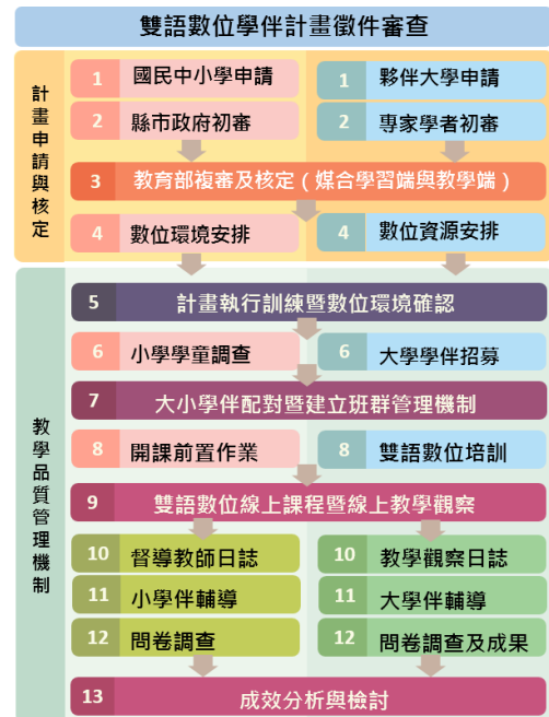
圖2 雙語數位學伴計畫實施流程