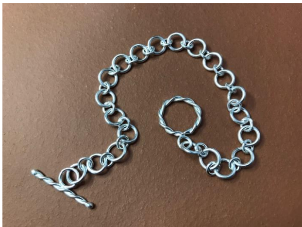
熔接、跳圈製作：手鍊創作