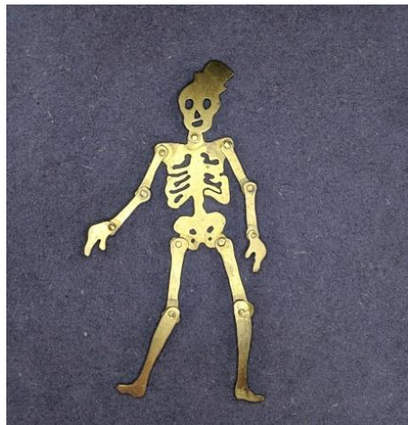
鉚釘冷接：首飾創作