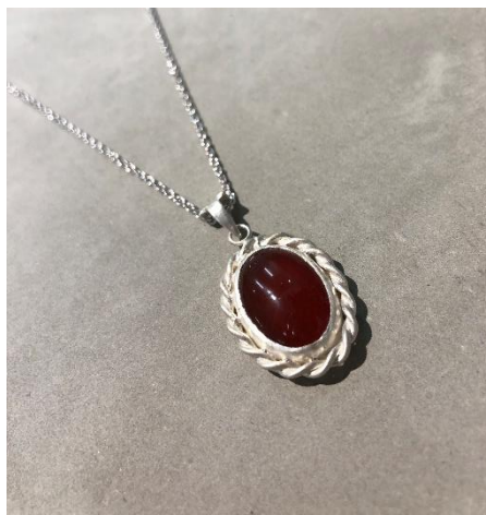
珠寶鑲嵌-包鑲：首飾創作