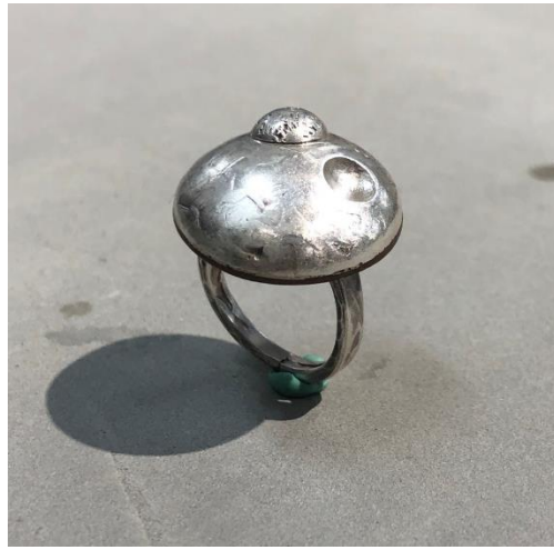
金屬敲擊成形、輾壓、硫化：首飾創作