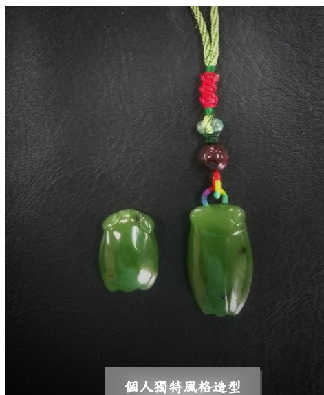
個人獨特風格造型 作品參考