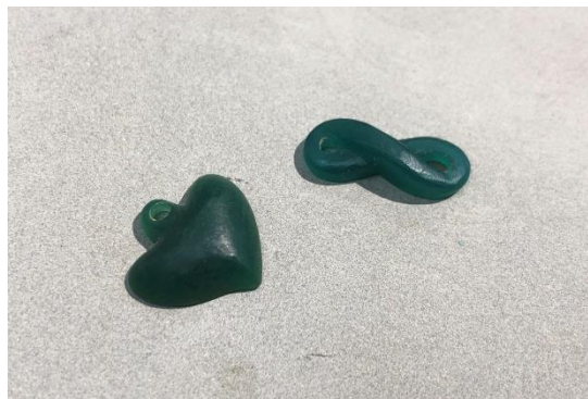
硬蠟片(平面浮雕)、(鏤空雕刻)