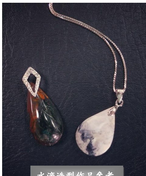
水滴造型作品參考