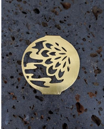
金屬鋸切：鏤空創作