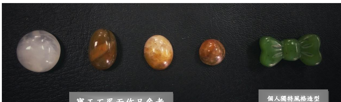
寶玉石蛋面作品參考