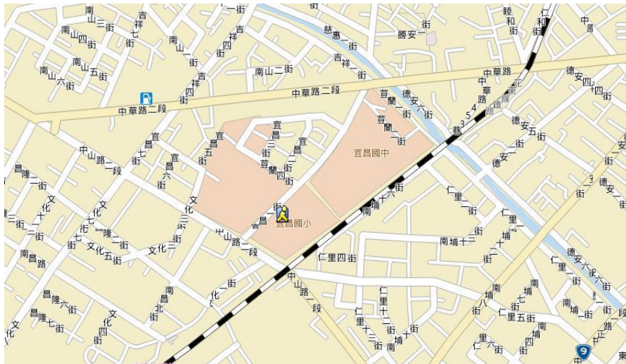
宜昌國小宜昌一街正門到花蓮縣學生輔導諮商中心平面圖