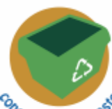
consumption & waste