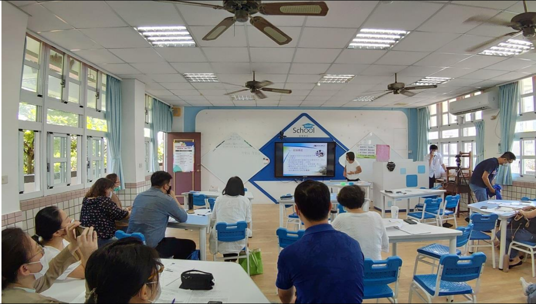
講師正在說明數位學習平台及相關工具帶來的好處