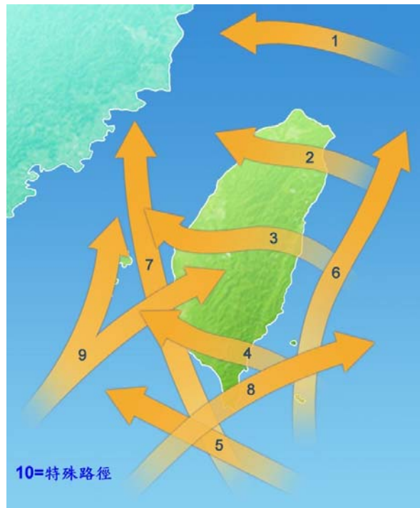
圖 2 颱風侵台分類示意圖