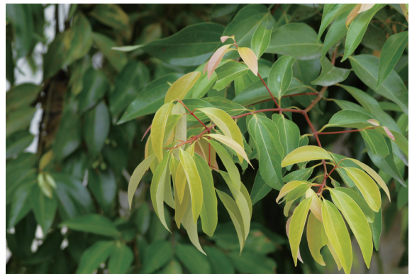
▲照片2 陰香小枝紅色。

蹤影，幾乎遍佈全島，即使位處較高海拔的陽明山竹子湖亦可見到其形影，甚至金門以及馬祖的南竿也有陰香苗木存在。