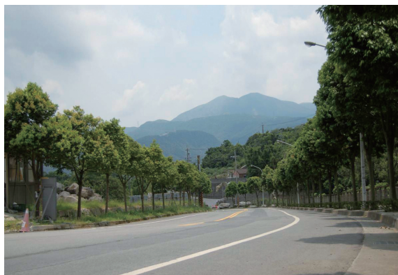
▲照片5 法鼓山朝聖大道兩旁的陰香。

再經進一步調查研究結果顯示，陰香在台灣適應性強，且生長快速、枝葉繁茂濃綠、種子生產量多、發芽率高、萌蘖性強，被廣泛選用為綠美化樹種之影響極需再嚴加評估。