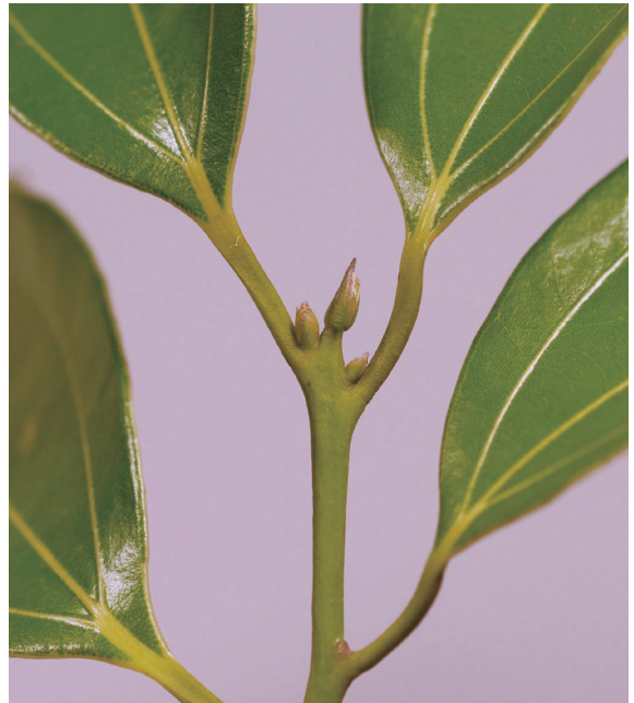
▲照片1 土肉桂的綠色小枝。

推估陰香最早引種進入台灣的時期約在1970年間，到2008年1月為止，林業試驗所調查結果顯示，在全台各縣市均已發現陰香的