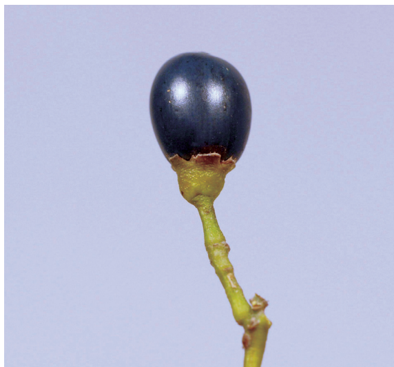
▲照片3 陰香果實。