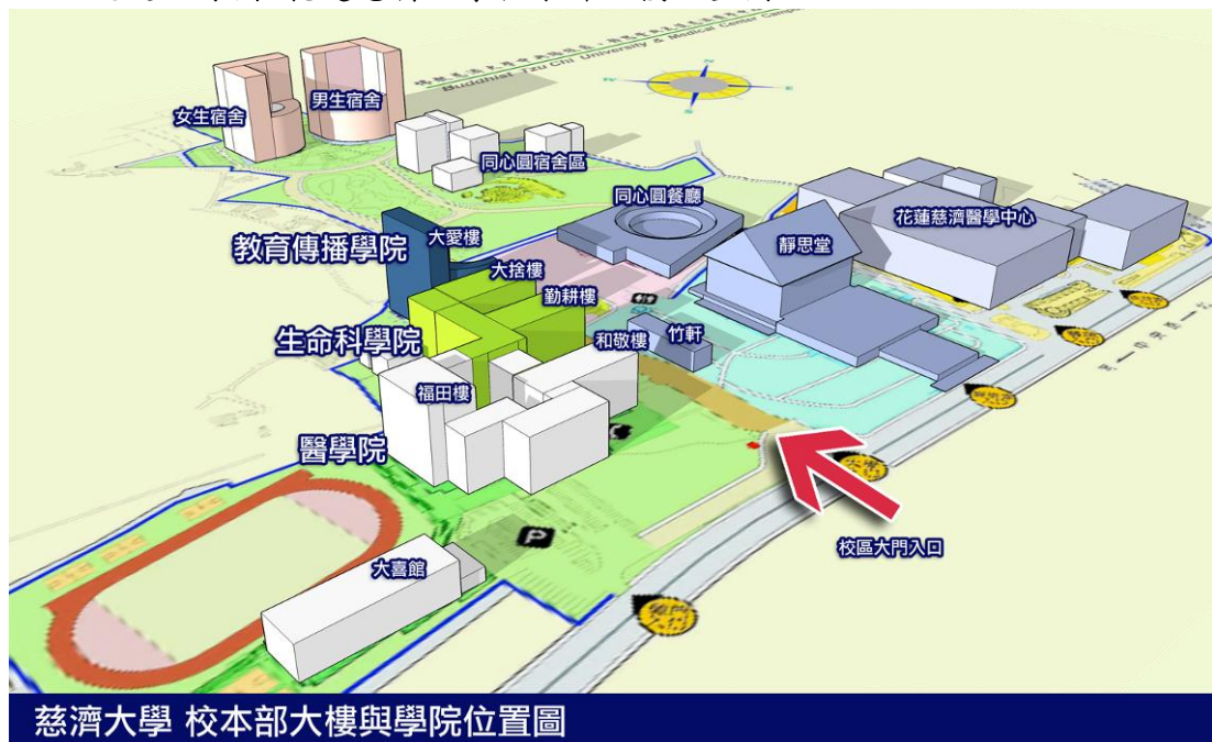
慈濟大學 校本部大樓與學院位置圖