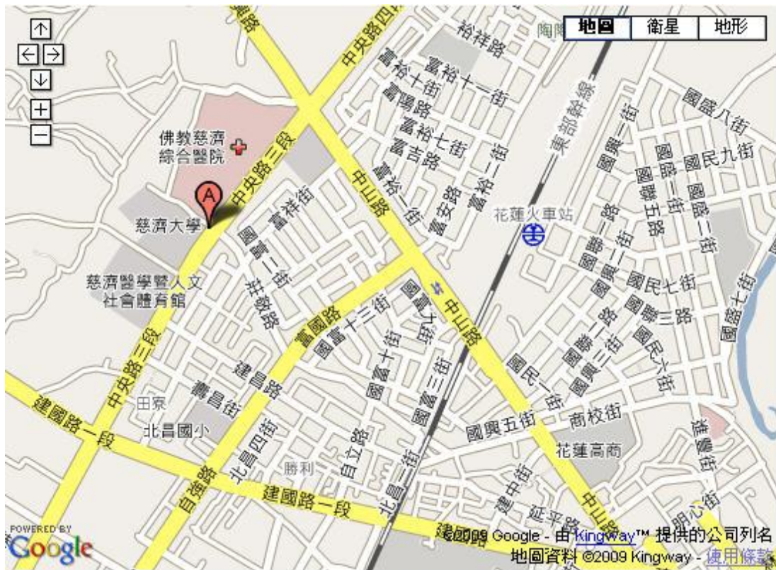
此地圖於 google map 網站下載