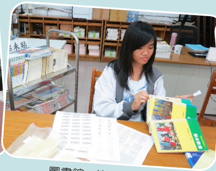
圖書館－協助書籍編目