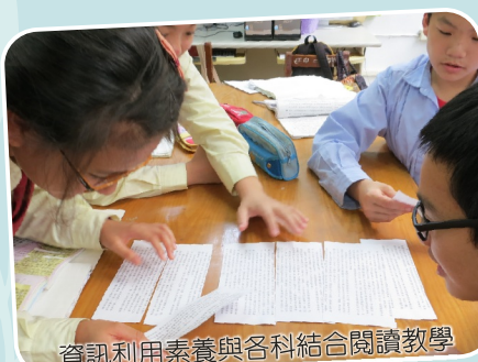
資訊利用素養與各科結合閱讀教學 國文課