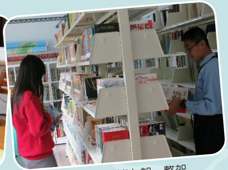
圖書館－書籍上架、整架