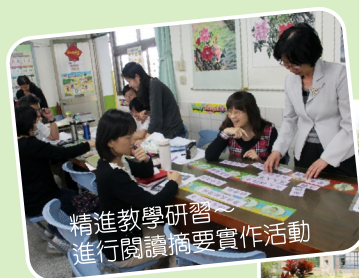
精進教學研習 進行閱讀摘要實作活動

稻香國小今年再度榮獲本縣國中小學推動閱讀績優學校，除了感謝評審們給予我們稻香團隊最大的肯定，這份榮耀也是對於本校繼續推動閱讀教育活動最大的支持動力，尤其閱讀活動已蔚為本校優良風氣，讓這美好的書香風氣長遠流傳下去，仍是稻香人共同的願望與使命。