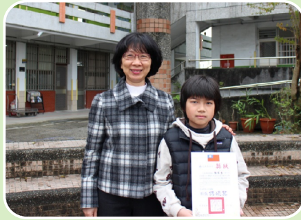
102學年度縣英語閱讀競賽第一名