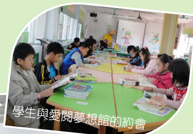
學生與愛閱夢想館的約會

閱讀教育計畫架構清晰、明確，從理念到規劃，建立具體可行全校閱讀策略，執行成果豐碩。建立圖書館運作及閱讀校本模式，結合課程與資源，營造閱讀環境氣氛，愛閱夢想圖書館很有創意。