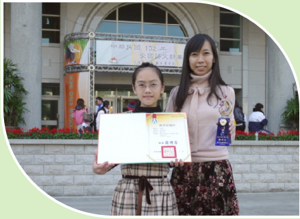
102學年度全國語文競賽朗讀全國第四