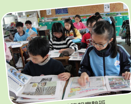
班級申請讀報實驗班