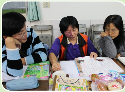
年級老師以共備方式做閱讀教學設計