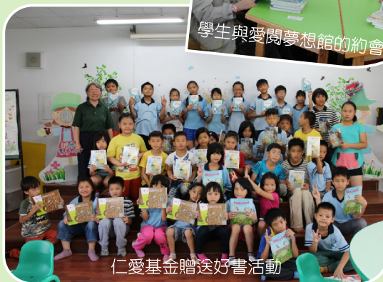
仁愛基金贈送好書活動