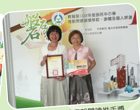
梅校長榮獲教育部閱讀推手獎