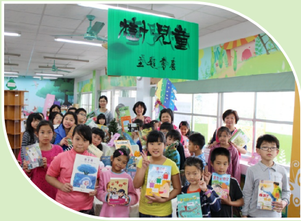
主題書展：樹與兒童