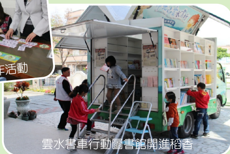
雲水書車行動圖書館開進稻香