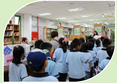
小朋友認識縣立公共圖書館