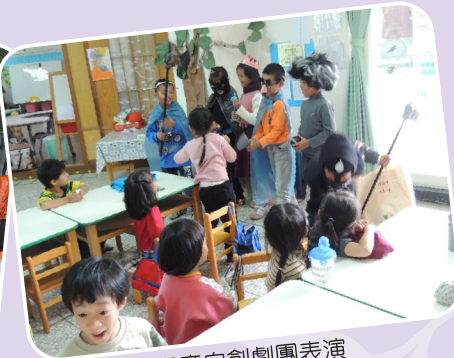
兒童自創劇團表演