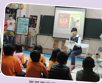
哥哥再見專書導讀