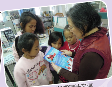
跨文化_老師代翻譯法文信

2. 學生閱讀成果發表：本校閱讀活動在認證上採取質量並重方式，家長、導師、主任、校長務必盡責把關學生閱讀質量，在閱讀的書目品質上要符合學生的學習能力，透過閱讀心得單的習寫，提升學生寫作能力，除展示於校園藝文櫥窗，期末匯集成冊，讓學生留下深刻的學習記憶外，期末也會頒發獎狀給閱讀表現優異的學生。學生自發性組織小劇團，利用課餘時間創作劇本，配合校園節慶活動展演；愛閱社學生更常以行動劇的模式推薦暢銷書籍，帶動圖書館借閱風潮。