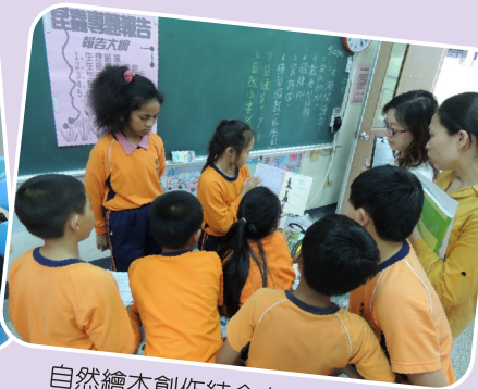
自然繪本創作結合自然領域昆蟲