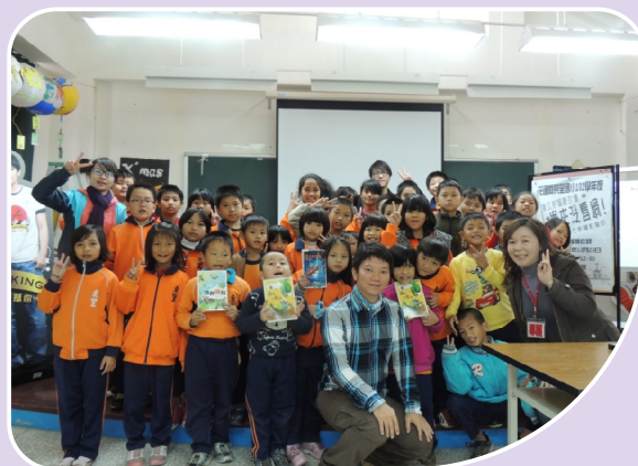
閱讀123昆蟲類文本專書導讀