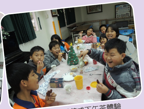
英國尋寶記英式下午茶體驗