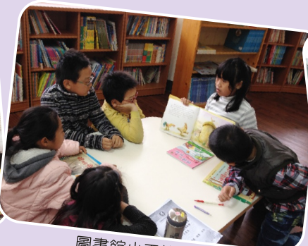
圖書館小天使說故事