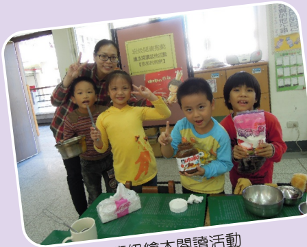
班級繪本閱讀活動