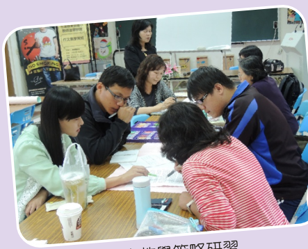
作文教學策略研習

2)教師閱讀理解指導能力提升：本校運作跨領域閱讀推動教師組織，定期召開閱讀社群教學研究會，除分享班級閱讀推動心得與具體執行活動外，並參與教育處舉辦之閱讀理解策略研習，精進教學能力，實際落實於各領域教學活動。