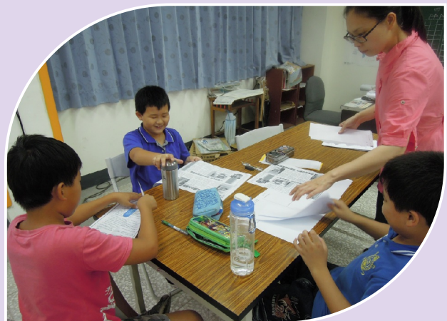
自我提問和讀報結合