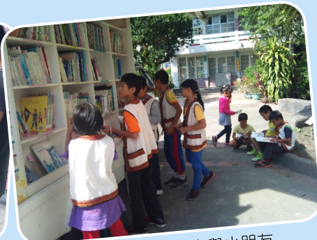
小太陽のメグメグ車與小朋友