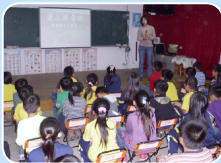
世界書香日－愛上圖書館