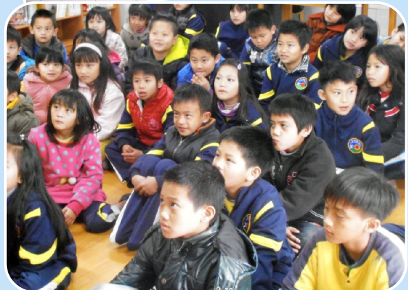
聽故事小朋友的最愛