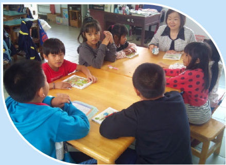
小朋友用心參與班級讀書會