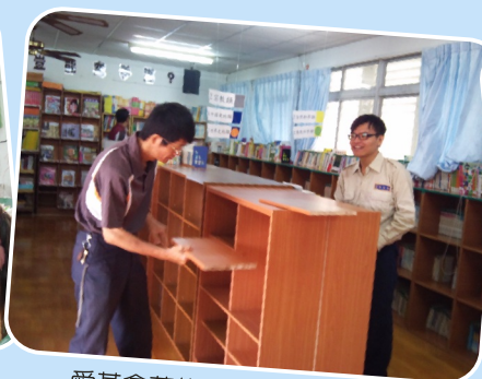
愛基會募集10個新書櫃贈本校