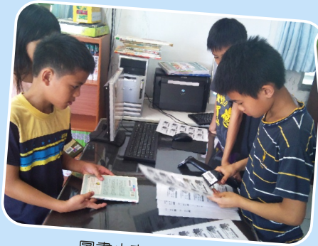
圖書小志工協助借閱