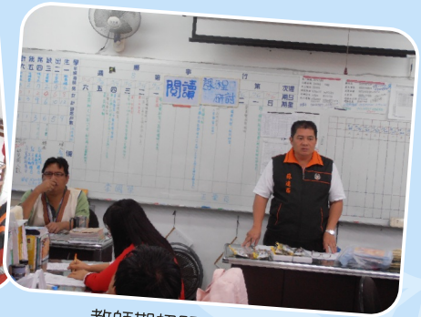
教師期初閱讀課程研討