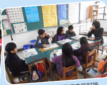
校內讀書會-進行對文本的討論