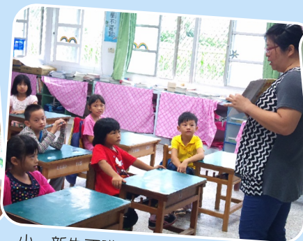
小一新生不識字老師讀故事給學生聽