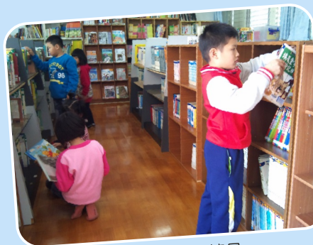
下課時間借書情景