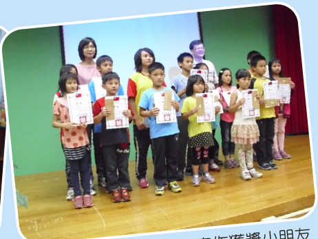
萬榮鄉圖書館查理心得寫作獲獎小朋友