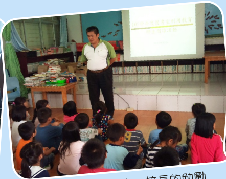
圖書館利用教育－校長的勉勵