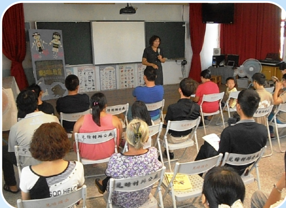
親職教育活動－親子共讀