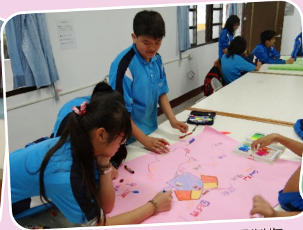
暑期閱讀寫作研習營_心智圖製作