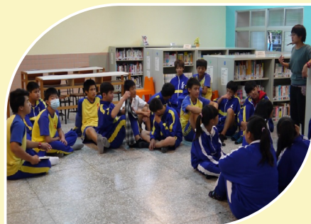
教師指導圖書室利用