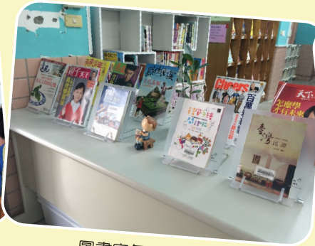
圖書室每月新書推薦