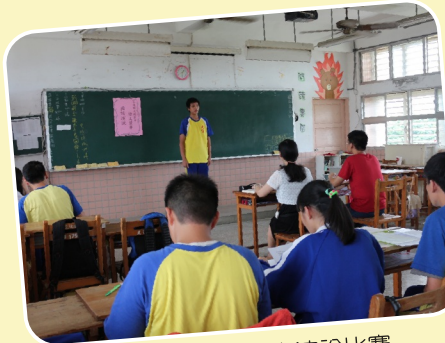
提升學生閱讀能力演說比賽