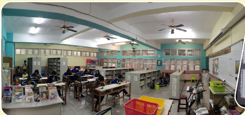
搬遷後新圖書室全貌