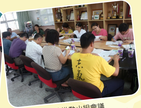
閱讀推動小組會議