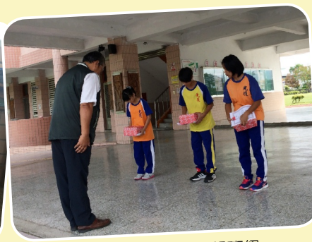
班級圖書角佈置得獎班級