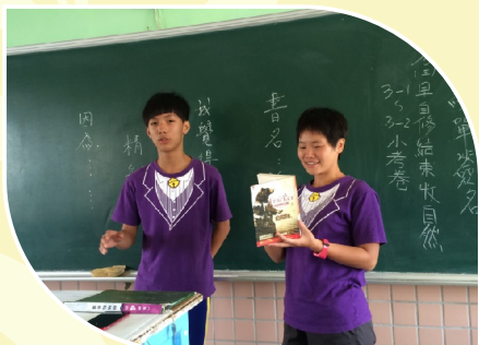
班級閱讀課學生導讀分享