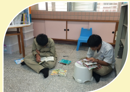
學生圖書室閱讀一角