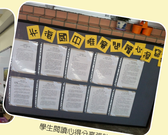
學生閱讀心得分享張貼