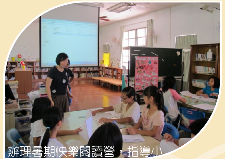
辦理暑期快樂閱讀營，指導小朋友發展自己的故事，製作屬於自己的繪本。