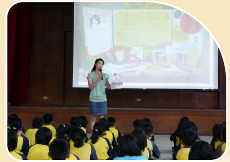
辦理主題書展活動，並由閱讀推動老師介紹相關書籍。

題進行『主題書展』，展示館內與主題相關的書籍進行延伸閱讀活動，藉由這樣的活動讓圖書室與讀者有更多的互動與交流，豐富學生的閱讀領域。