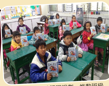
透過各項閱讀課程規劃，推動班級讀書會。