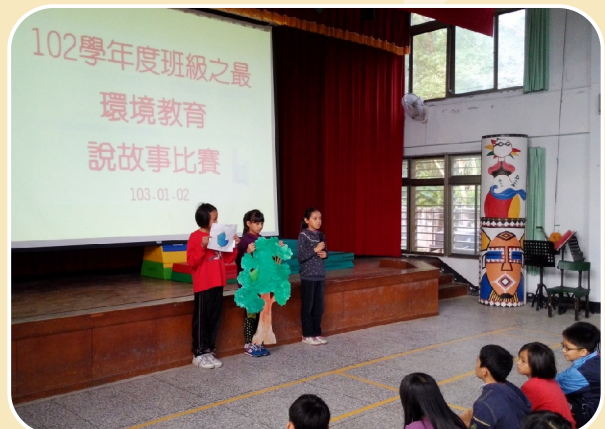
每學期進行班級之最一說故事比賽，透過閱讀→理解→摘要→發表的學習歷程，擴大學生的閱讀層面。

校長能以身作則，領導教學團隊投入各項閱讀教學活動，計畫周詳，具體可行。能檢核閱讀能力，建立閱讀學習護照，辦理主題書展，值得肯定。