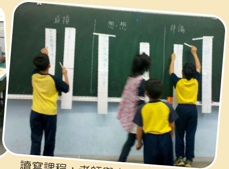
讀寫課程：老師與大家一起討論並引導寫作。

力，因此規劃讀寫課程，期望做到「讀寫結合」，以提升學生語文能力。為延續長期建立的討論氛圍，以「深耕閱讀」為主題，針對閱讀教學相關策略提出經驗分享及討論，透過教師間的相互激盪和共識凝聚，共同為校園閱讀推廣活動而努力。