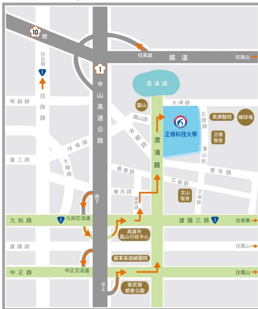
註：中山高速公路南下九如交流道禁止直接左轉九如路，須直行經過引道再接回九如路。

3. 客運：搭乘高雄客運 60、8006、8008、8009、8021、8041、8048、8049、橘 12 等路線至正修科大站下車。