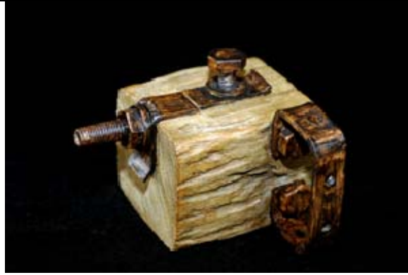
林松本老師作品五行方壺：採手捏成型配合仿鐵造型整體有木. 有金屬. 可泡茶水. 媒材為土經窯火 1230 度燒成 構成金木水火土故取名為五行壺