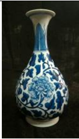
青花彩繪研習班學員作品