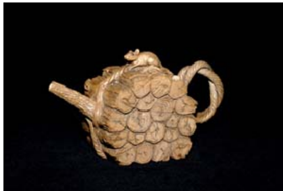
林松本老師作品 鼠柴壺