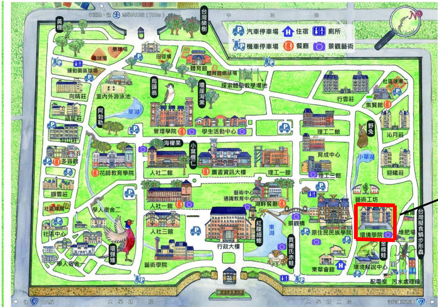
(二)上課地點：環境學院校園位置示意圖