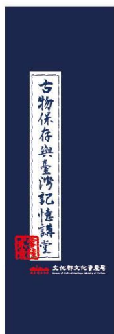
古物講堂帆布提袋

*參加講堂活動送講堂「專屬深藍古籍意象厚帆布提袋」好禮喔，讓珍貴之古物與文化走入你我生活當中，變成生活之一部分。