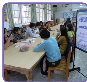
家長閱讀義工小組會議