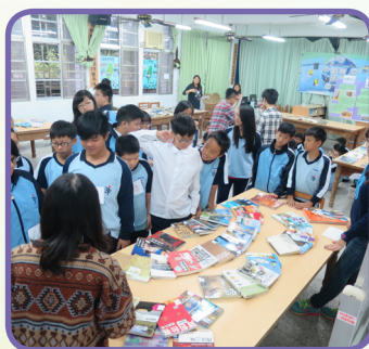
李真文教授閱讀活動營 —深度旅遊閱讀