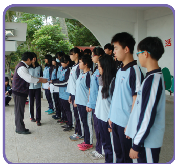
校長公開表揚小論文獲獎

為了提升學生的閱讀興趣及知識能力，學校佈置了「人文書香 深度閱讀」專用公告欄，舉凡報上刊登的優美文章，奇聞軼事、科學新知等都是蒐集的內容，剪輯之後張貼於公布欄，讓學生隨時隨處都能吸取新知，並且達到廣泛學習、大量吸收成效。