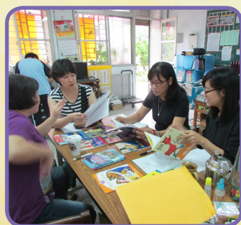
英語教師討論推動閱讀繪本