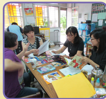
英語教師討論推動閱讀繪本