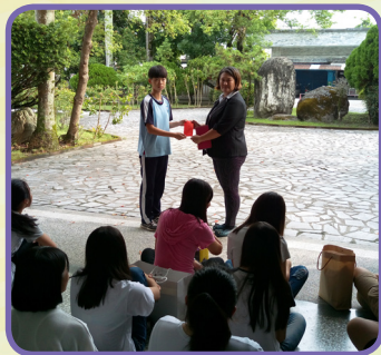
家長會代表公開頒發語文競賽獎勵