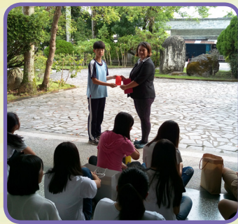
家長會代表公開頒發語文競賽獎勵