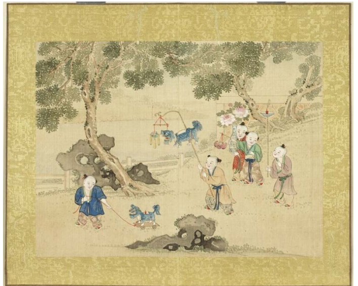
歡洽寰區 冊 第五開〈花燈會〉