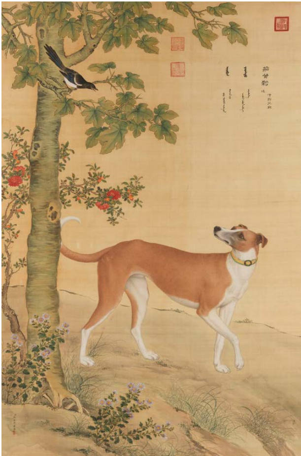
郎世寧 十駿犬茹黃豹