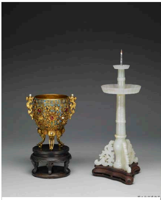
金甌永固杯、玉燭長調燭臺