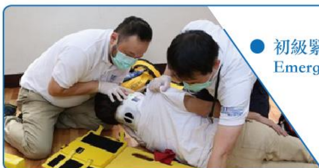
● 初級緊急救護技術員 Emergency Medical Technician 1