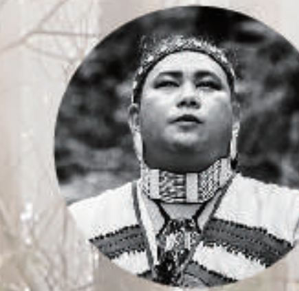
合音、口簧琴 東冬·侯溫