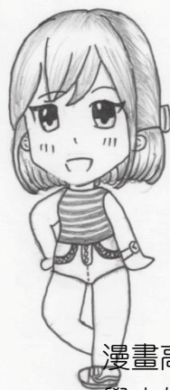
漫畫高手 學生作品