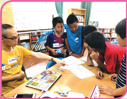
世界高峰會 _ 閱讀統整與發表