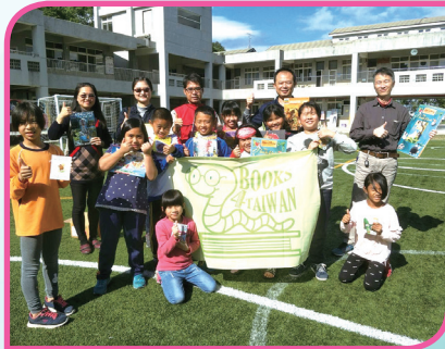
英語圖書贈書活動