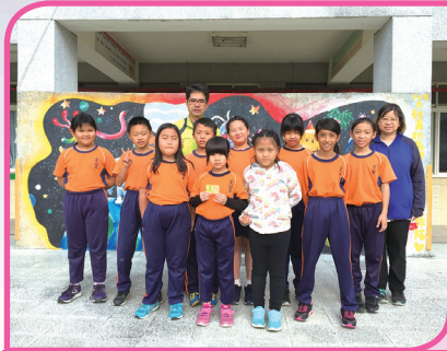
企業合作 _ 7-11 好鄰居閱讀集點頒獎