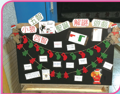
閱讀融入 _ 聖誕解謎遊戲