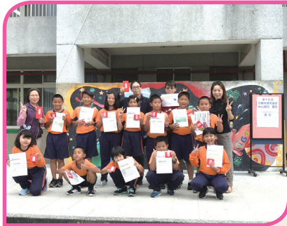
投稿報社獲刊頒獎