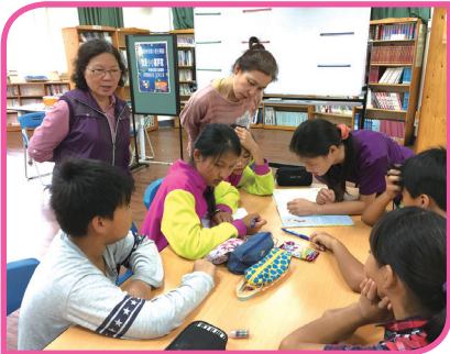
新象協會 _ 書評家