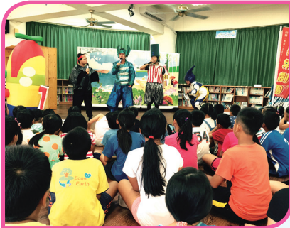
蘋果劇團戲劇欣賞