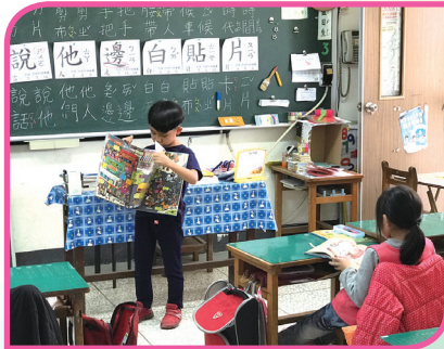
班級閱讀 _ 說故事