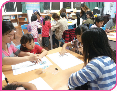
親職教育 _ 繪本創作