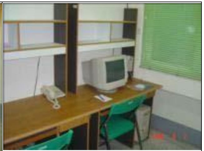
2 人套房書桌 4 人雅房書桌