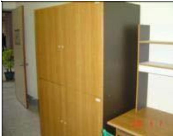
2 人套房衣櫥 4 人雅房衣櫥