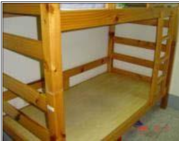
2 人套房床鋪(3 尺*6 尺) 4 人雅房床鋪(3 尺*6 尺)