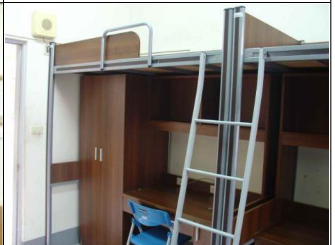
5 人雅房床鋪、書桌、衣櫥 床鋪(長 192CM、寬 90CM)

※選手村提供寢室床鋪、書桌、椅子、衣櫥等寢具設備，其他個人用品（盥洗用具、電腦、網路線等），請自行準備，個人用品亦可於進住當天現場採購。