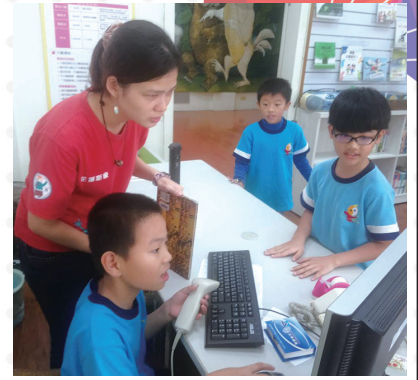
新象協會一日店長