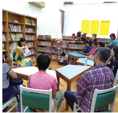
碧雲莊圖書館參訪