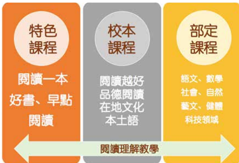
圖 4 閱讀與 108 課綱、學校特色課程及學校本位課程等結合情形

本校全面啟動 108 課綱課程教學，以閱讀理解教學策略為推動本校各項教學活動之方針，故部定課程與校定課程皆融入閱讀理解教學。