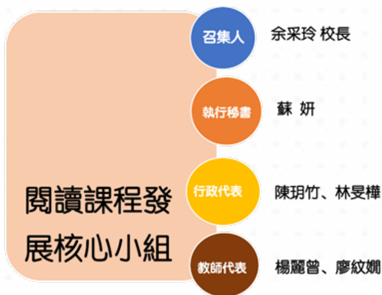
圖 2 閱讀課程核心推動小組