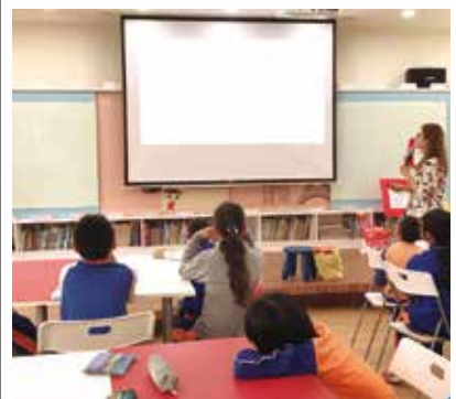
專題書展 - 食字路口