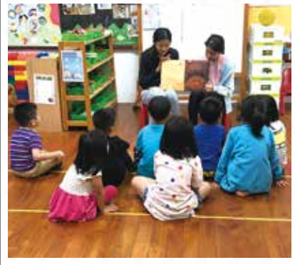
六年級進幼兒園說故事