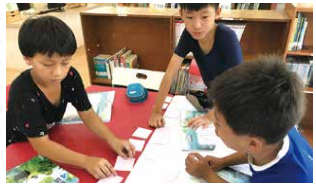
四年級延伸閱讀資料分類統整