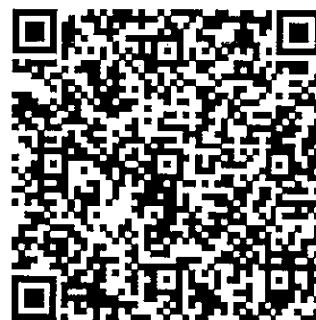
加入臉書追蹤消息

指導單位：衛生福利部社會及家庭署 主辦單位：臺灣兒童發展早期療育協會 合辦單位：東海大學音樂學系 協辦單位：長庚大學早期療育研究所、臺中教育大學特殊教育學系