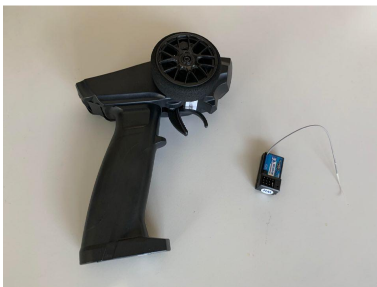
市售 3 通道 2.4GHz 槍型遙控收發器

本競賽禁止使用市售 2 通道、3 通道或多通道之 2.4GHz、27MHz (或其他頻率) 槍型或板型遙控收發器 (或由類似控制元件組合) 作為控制遙控帆船之裝置 (如下二圖所示)，違者以 失格 認定。