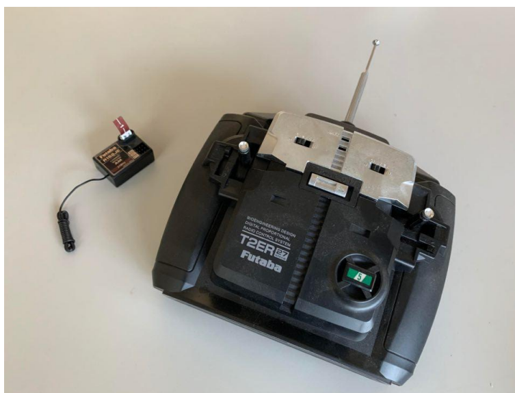
市售 3 通道 27MHz 板型遙控收發器