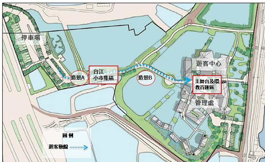
「2021 濕地日」活動空間配置及遊客動線規劃示意圖

邀請對象： 濕地保育相關部會機關、各地方政府、濕地保育利用計畫執行單位(含民間 NGO/NPO 團體)、大專院校等相關科系及在地民眾。