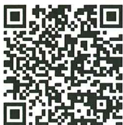
報名網址 QR CODE