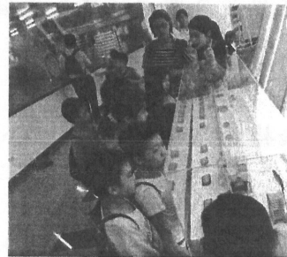
↑參觀金格食品觀光工廠-卡司蒂菴樂園