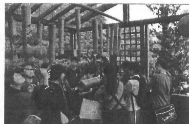
↑參觀金格食品-生態池園區