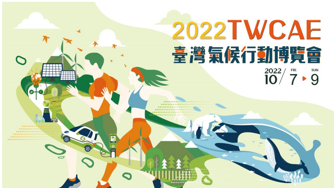
圖、博覽會主視覺示意圖

政府氣候行動館、城市氣候行動館、公民氣候行動館、企業氣候行動館、 創新氣候行動館