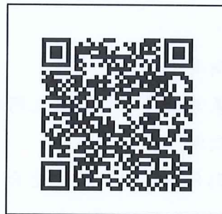
團體報名表單下載