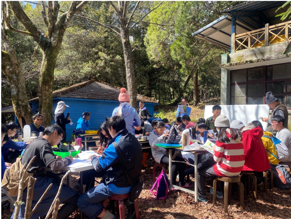
圖 1：樟湖生態國民中小學於塔塔加楠溪保育研究站辦理科學教育活動

當地豐富的教育資源，並將既有教案轉化為其他更多元的教育內涵。另預定在 10-11 月號召參加過工作坊的教師，一同帶著學生到塔塔加進行科學探究實作，以身歷其境感受玉山園區豐富的生態之美。希冀廣大的玉山園區可以成為國人重要的在地學習場域。