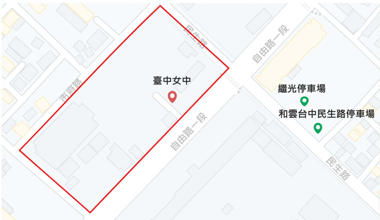
圖 2 臺中女中（9月6日實體說明會）周邊停車場地圖