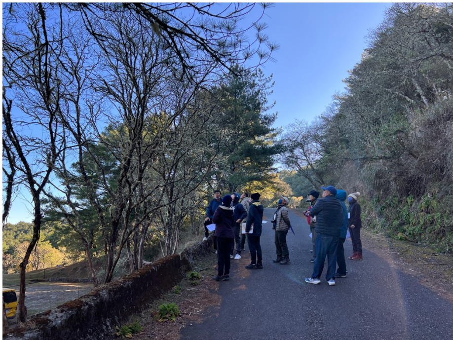
圖 2：塔塔加地區科學教育活動實地生態觀察