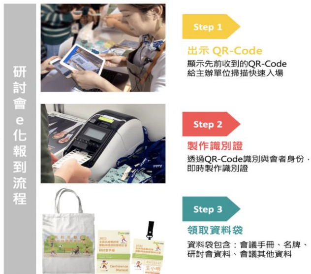
圖 3、研討會 e 化報到流程示意圖