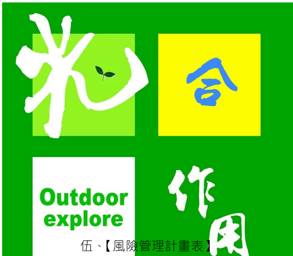
伍、【風險管理計畫表】