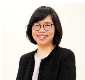
衛生福利部國民健康署 賈淑麗副署長

國立體育學院體育研究所碩士，曾任前行政院體育委員會科長、臺中市政府體育處處長、桃園市政府體育局副局長、教育部體育署主任秘書。房瑞文副署長自臺東師專畢業後原擔任小學教師，有感於臺灣體育亟需人才，爰於研究所畢業後於 87 年通過高考，從基層公務人員做起，在地方和中央機關任職，擁有豐富的教育及體育行政經歷。