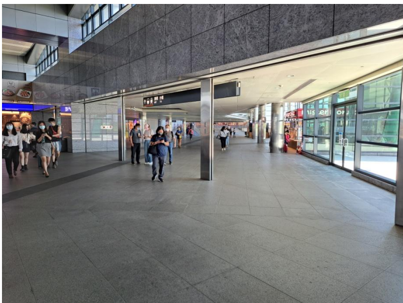
1. 由高鐵 3 出口往台鐵方向