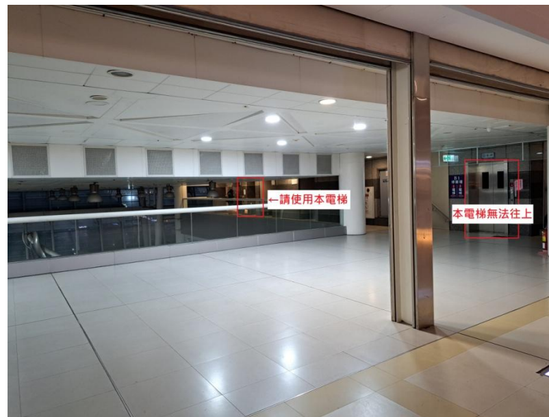
4. 如需使用電梯，請搭乘右側第二台電梯