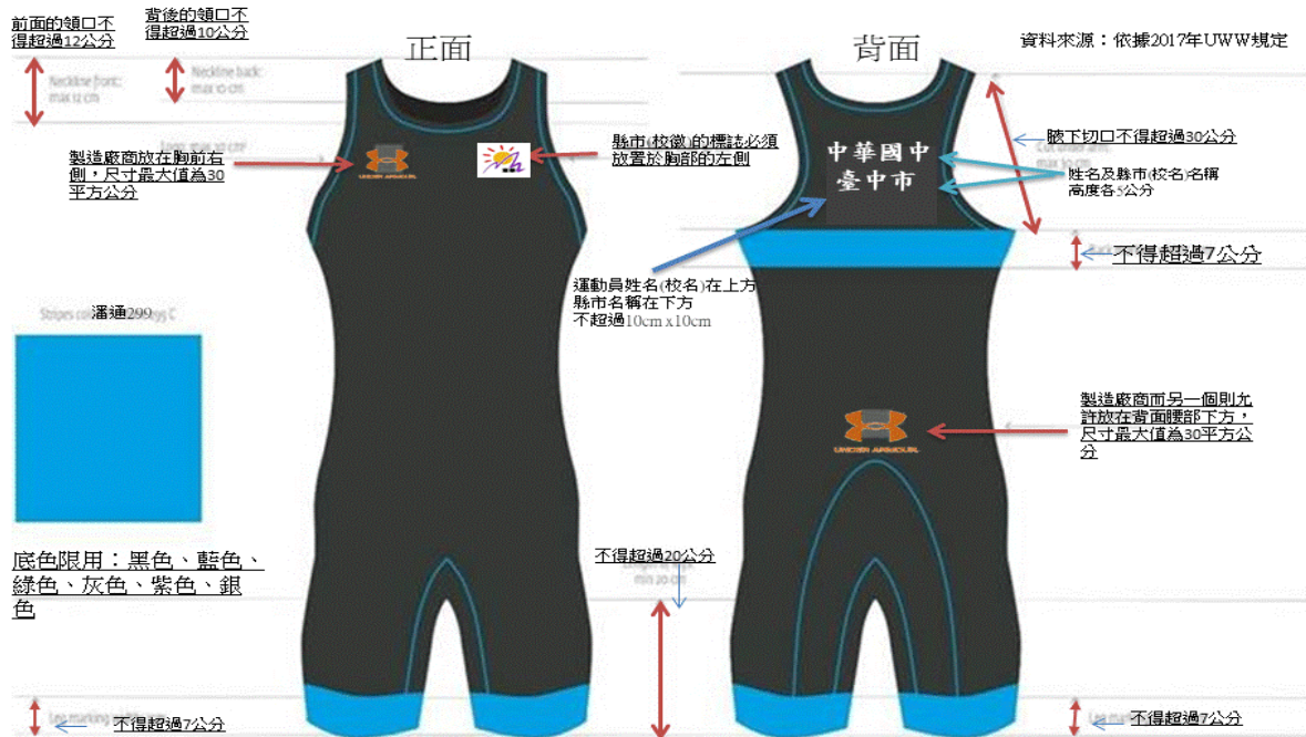
角力服腿的長度必須停止於膝蓋上方，並且不得短於膝上15公分