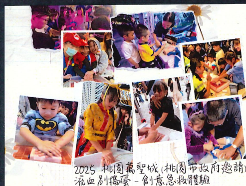
2025 桃園萬聖城 (桃園市政府邀請) 流血別搗蛋 - 創意急救體驗