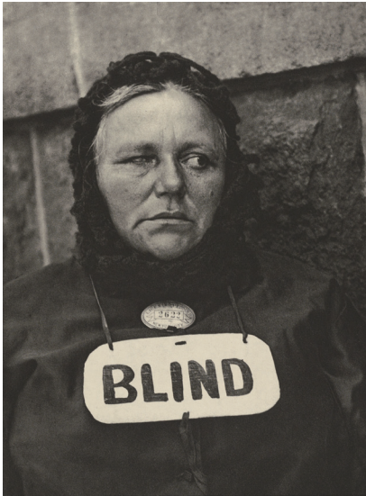
保羅·史川德 (Paul STRAND) 〈紐約(盲婦)〉 New York (Blind Woman) 1916 凹版照相 數位影像由蓋堤博物館開放內容計畫提供

策展人透過美國蓋堤博物館 (J. Paul Getty Museum) 的歷史典藏，檢視西方視覺文化如何「生產」盲人和視障者的形象。透過這些影像，觀眾被引導去反思：當攝影剝奪了被攝者的回視能力，我們看見的是盲人的真實，還是明眼社會對盲人的恐懼與想像？