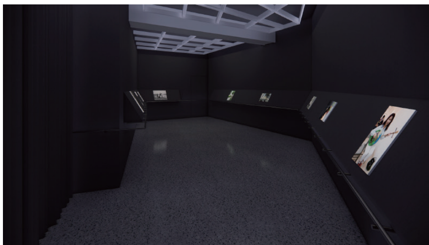
「黑箱作業」展場模擬圖

「黑箱」(Camera Obscura) 是攝影機的原型，也是光線被捕捉的暗室。在此展間中不僅是無障礙科技展示，更是一種「通用博物館」的實踐：當光線消失，人類才真正開始學習如何用全身的感官去「看見」。明眼觀眾必須依賴觸覺感知、口述影像聲音引導等探索作品。