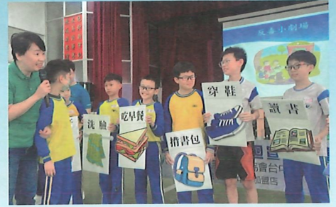
▲瞭解毒品的影響－趣味短劇