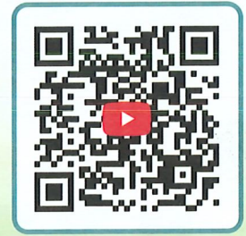
《捷徑是最遠的》 反毒繪本動畫