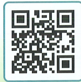
台灣無毒世界協會官網