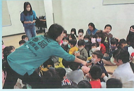
▲歡樂中學習－演講互動