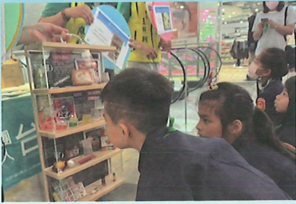
▲毒品變裝秀－辨識仿真毒品