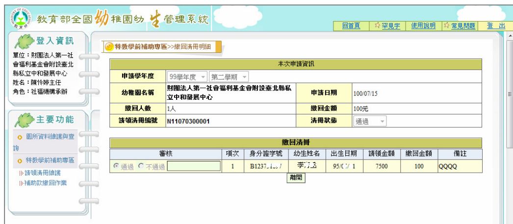
圖 18 請領清冊審核結果畫面

(2)點選【清冊編號】可以觀看縣市承辦審核結果，圖 18 請領清冊審核結果畫面。