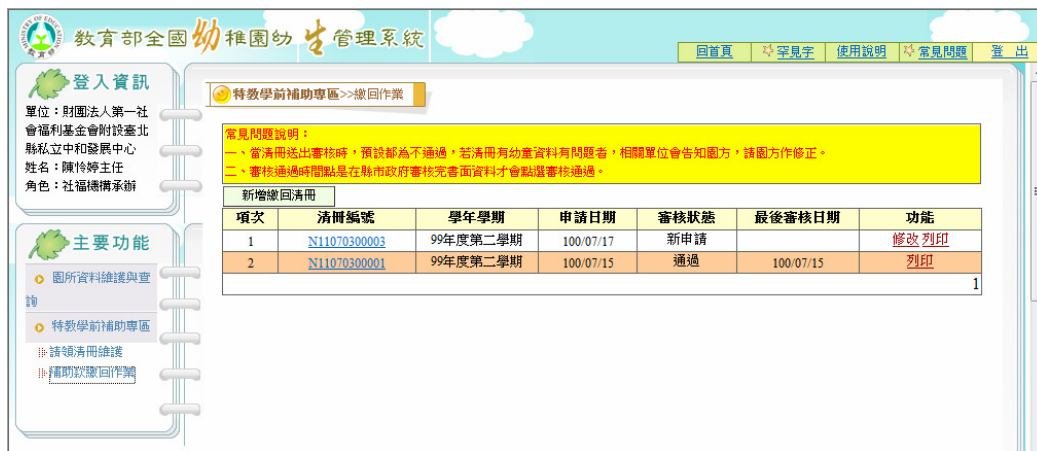
圖 13 補助款繳回清冊查詢結果畫面