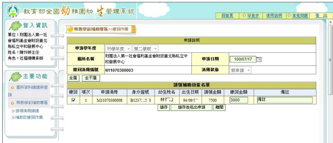
圖 17 請領清冊修改畫面