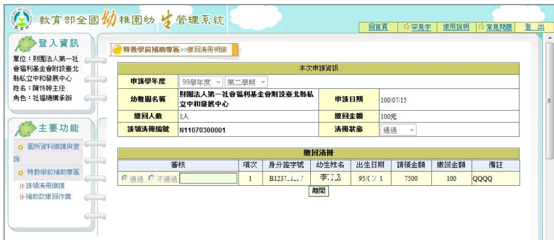
圖 18 請領清冊審核結果畫面

(2)點選【清冊編號】可以觀看縣市承辦審核結果，圖 18 請領清冊審核結果畫面。