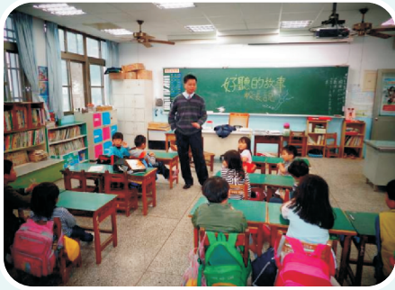
校長在本校一年級和四年級說故事之情景。