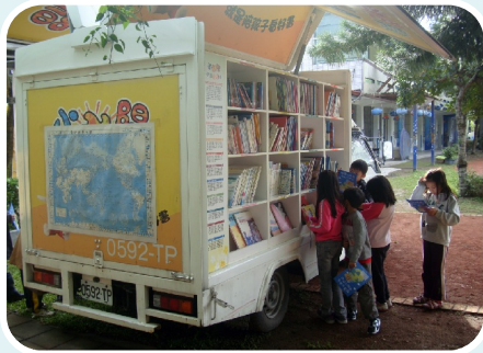
導師帶領小朋友參觀、挑選「小太陽ㄉㄉㄉㄉ車」的書籍。