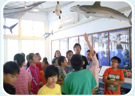
透高年級的小朋友在曼波館為來訪師生進行海洋生態的導覽與解說。