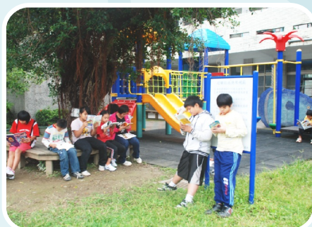
樹傘下的閱讀天地