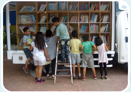
學生們在挑選新城書香巡迴列車上的書籍。