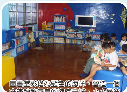
圖書室彩繪為藍色的海洋，營造一個充滿神祕氣息的海底書城，小小曼波最喜愛在書海裡悠游、探索。