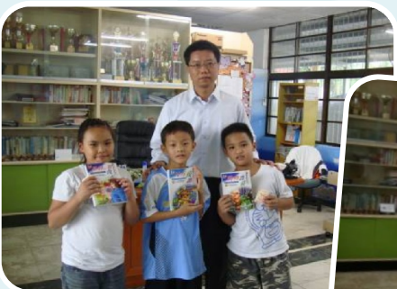
校長致贈小朋友書籍，鼓勵小朋友多多從事閱讀活動。