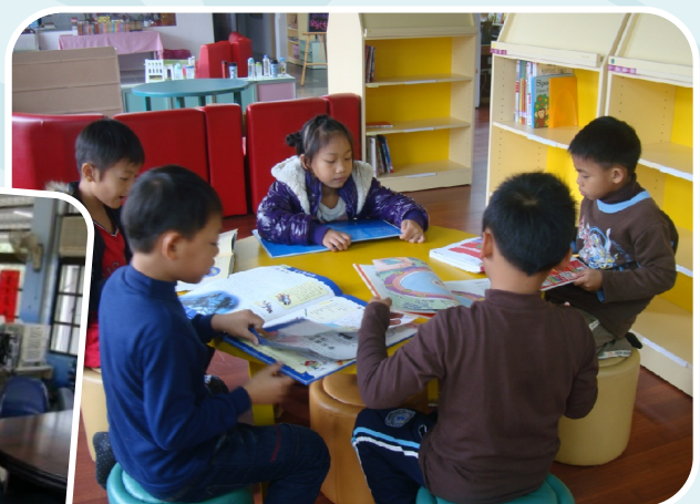
小朋友在市立圖書館兒童分館閱讀的情形。