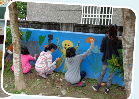
透過各項特色閱讀探索活動，使孩子增進對自然的好奇，對生命深度的發掘，進而廣泛的閱讀各類文學、科學作品，養成主動求知與閱讀的慾望。