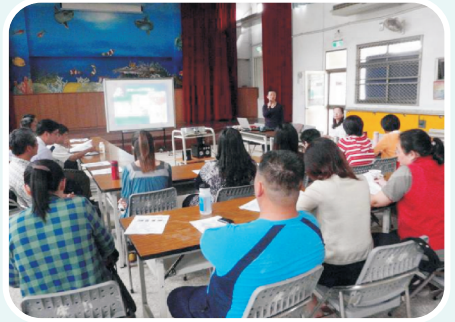
我們也常與鄰近聯盟小學一起交流，一起參與研習學習閱讀教學的策略。