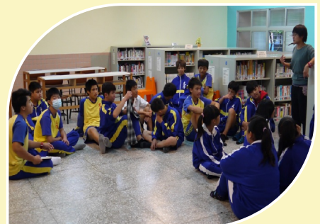
教師指導圖書室利用