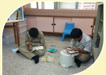
學生圖書室閱讀一角