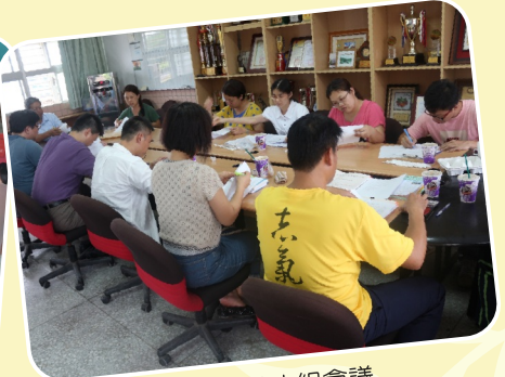
閱讀推動小組會議