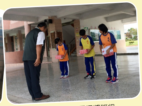
班級圖書角佈置得獎班級